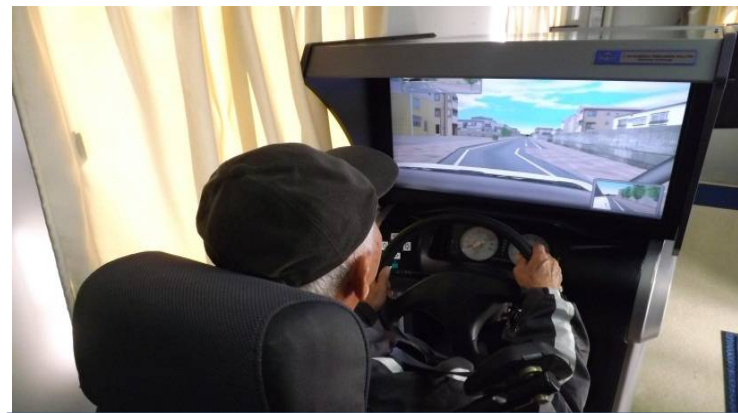
ドライビングシミュレータによる講習