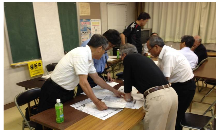
交通安全マップ作成