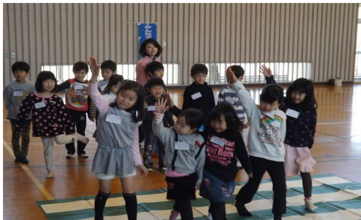
保護者等も含めた交通安全教室