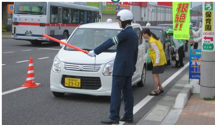
シートベルト着用街頭キャンペーン