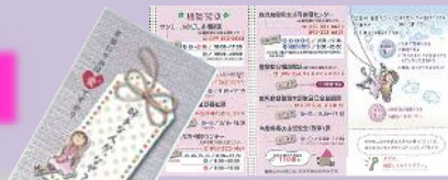
★DVリーフレット (カードサイズ)

《パープルリボン街頭キャンペーン》 カードサイズのDVリーフレットなどを配布し、 DV防止のための情報提供及び啓発 を行います。