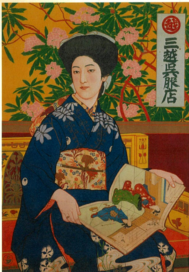
橋口五葉《此美人》1911年、リトグラフ・紙

郷土出身の美人木版画家として名高い橋口五葉は、「吾輩ハ猫デアル」をはじめとする夏目漱石の単行本の装幀を手掛けるなど、優れたデザイナーでもありました。