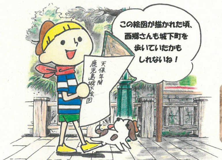
イラスト：池内花歩