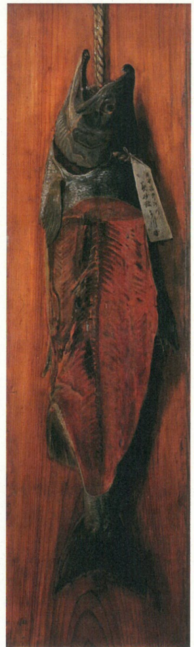
高橋由一《鮭図》 笠間日動美術館（山岡コレクション）