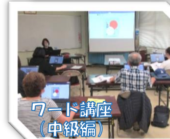
ワード講座 (中級編)