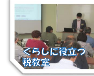
くらしに役立つ 税教室