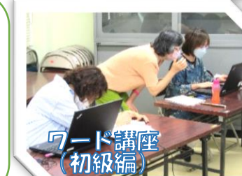
ワード講座 (初級編)

基本の動きやルールなど丁寧に教えていただきました。 新しい友達もできてよかったです。