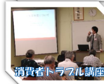
消費者トラブル講座