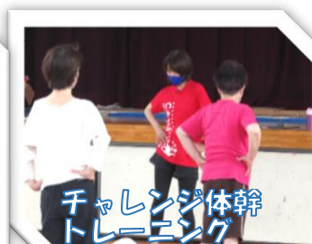
チャレンジ体幹トレーニング