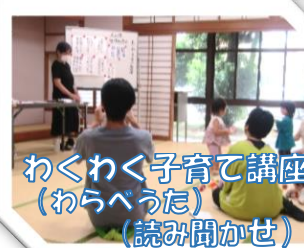
わくわく子育て講座 (わらべうた) (読み聞かせ)

チューリップなどをみんなで吹いて楽しかったです。 すごくわかりやすい指導のもと上達できました。