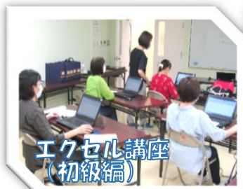
エクセル講座 (初級編)

地図アプリやカメラの使い方がよく分かりました。 分からないことがだんだん分かり、楽しかったです。