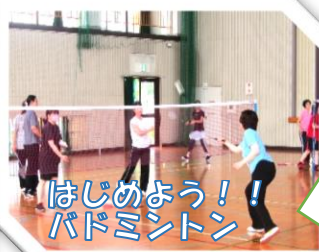
はじめよう！ バドミントン

基本の動きやルールなど丁寧に教えていただきました。 新しい友達もできてよかったです。