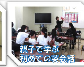
親子で学ぶ 初めての英会話