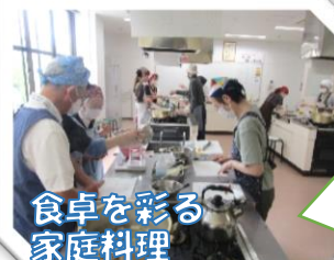
食卓を彩る 家庭料理

塩こうじを使ったレシピはとても役に立ちました。 班の皆さんと協力しておいしくできました。