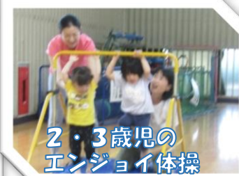
2・3歳児の エンジョイ体操