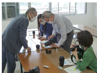
一眼レフカメラ入門