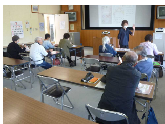
シニアスマートフォン

5月から始まった郡山公民館前期講座(20講座)では、熱心に学ぶ多くの方々の姿が見られました。(下の写真は、一部の講座の様子です。講座名は、略してあります。) 後期講座の申込は、9/1(金)~9/20(水)の期間です。一緒に、楽しく学びませんか。