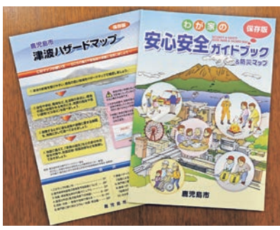
現在の安心安全ガイドブック・津波ハザードマップ

また、本市では、洪水、土砂災害、桜島火山、津波に係るハザードマップを整備し、防災研修会等での周知に努めているほか、29年度には、更新した防災マップを掲載した「わが家の安心安全ガイドブック」を全世帯に配布する予定としている。