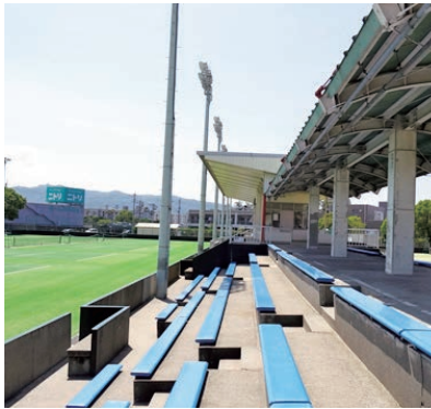
国体に向け改修する東開庭球場

答 絶滅の恐れのある野生動物は、県の28年のレッドデータブックによると、県内では、絶滅危惧1類、2類合わせて1436種で、市内では211種が確認されている。分布と生息状況については、15年と28年を比較すると、絶滅の恐れのある種が、県内では、オヒキコウモリやニホンウナギなど213種、市内では、サシバやアキアカネなど14種増加している。また、ゲンゴロウのように、以前