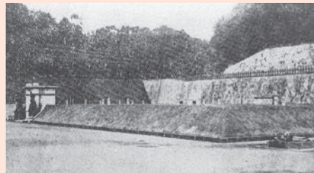
鹿児島の古い配水池の一つ・上之原配水池

大正2年3月の市会(市議会)議員選挙後、市会は、同年7月に水道委員会を設置。市長も、国との間で国庫補助、起債の交渉を開始した。そのさなか、同年11月に市長が急死し、翌3年1月には桜島が大爆発。上水道敷設は棚上げの状態となっていた。