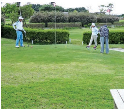
パークゴルフ場（霧島市）

答 平成29年内をめどに、基本計画案の検討・策定を行い、その後、パブリックコメント手続きを実施し、29年度中に基本計画を策定する予定である。