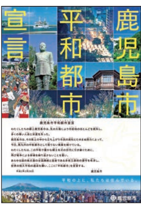
→鹿児島市平和都市宣言ポスター

答 「賢人会議」は、国際的安保環境の悪化、核軍縮の進め方をめぐる核兵器国および非核兵器国間の意見対立等の現状を踏まえ、双方の橋渡しを務めるものであり、核軍縮の実質的な進展に資する会議であるとされている。 わが国は、唯一の被爆国として、多くの尊い生命を瞬時に失う悲惨な体験をし、また、その後遺症により不安な生活を強いられるに思いをいたすとき、平和都市を宣言している本市の市長として、一日も早い、あらゆる国の核兵器の全面廃絶と世界の恒久平和の達成を心から願っている。