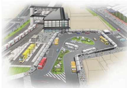
鹿児島駅前広場イメージ

駅前広場のデザインを検討していきたいと考えている。 供用開始に向けた今後のスケジュールについては、現在実施中の詳細設計を踏まえ、平成30年度に仮駅舎の工事着手、31年度に新駅舎および自由通路の工事着手、32年度に駅前広場の工事着手と新駅舎および自由通路の供用開始、そして、33年度に駅前広場の供用開始を予定している。