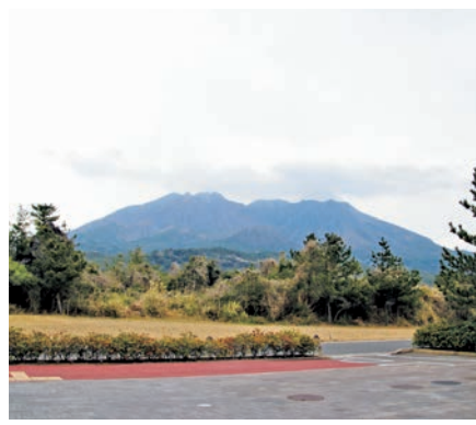
桜島の溶岩道路・溶岩群の松の木

規制があり、エリアごとに規制内容が異なることから、樹木の伐採についての考え方を各機関に伺ってみたいと考えている。