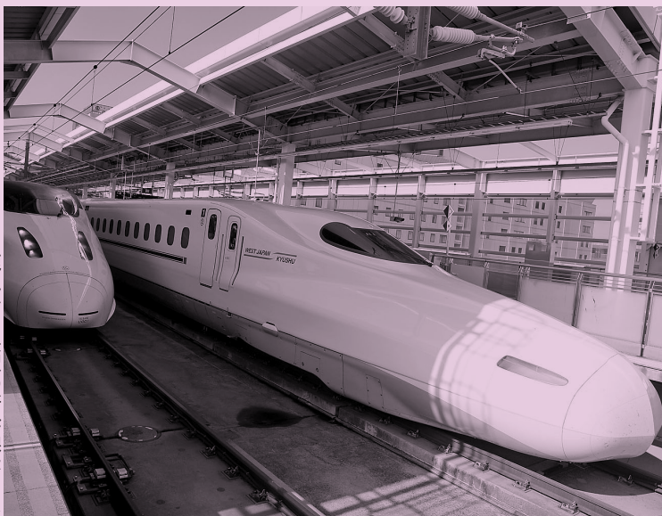
▶ 鹿児島中央駅の新幹線ホーム