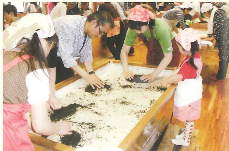
手もみ体験の様子