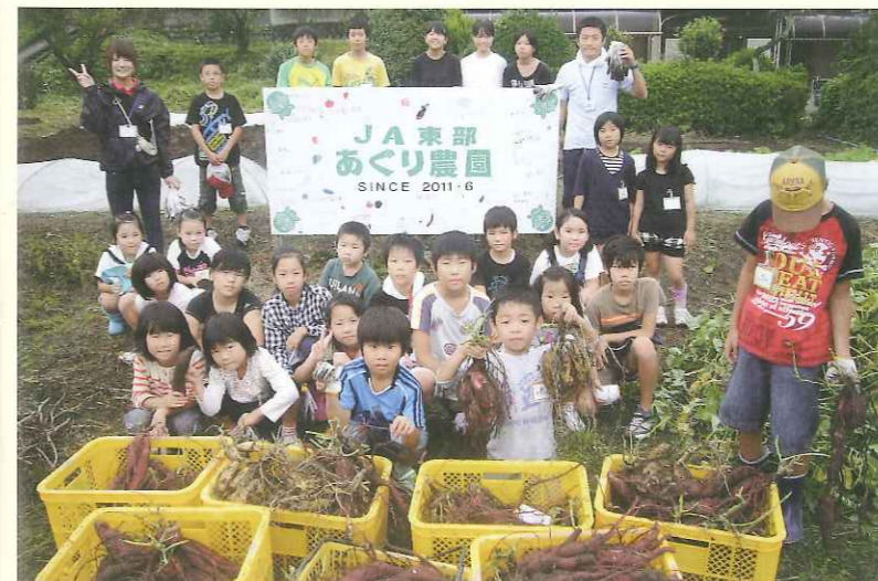
いもほり体験の様子

主に小学校1～6年生を対象に、畑での野菜作りや調理体験をみんなで一緒にに行います。実際に体験することで、食べ物や農業の大切さを楽しみながら学ぶことができます。