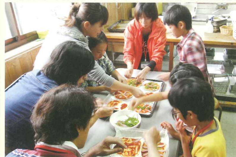
ピザ作り体験の様子

この牧場では、絞った牛乳を使った体験や動物とのふれあいを通して、命の大切さや食べ物へのありがたさを学びます。また、近くには牧場の搾った牛乳を使ったソフトクリームやピザが食べられる販売所もあります。