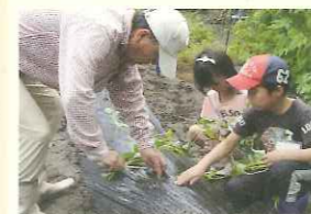
野菜の植え付け体験の様子

活動団体/東部農業協同組合 体験場所/市内の農村地域 申込・問合せ先/ JA東部本所管理部企画課 事務所住所/鹿児島市東谷山2-22-23 TEL/099-268-2261 URL/http://ja-toubu.jp/ 駐車台数/約20台