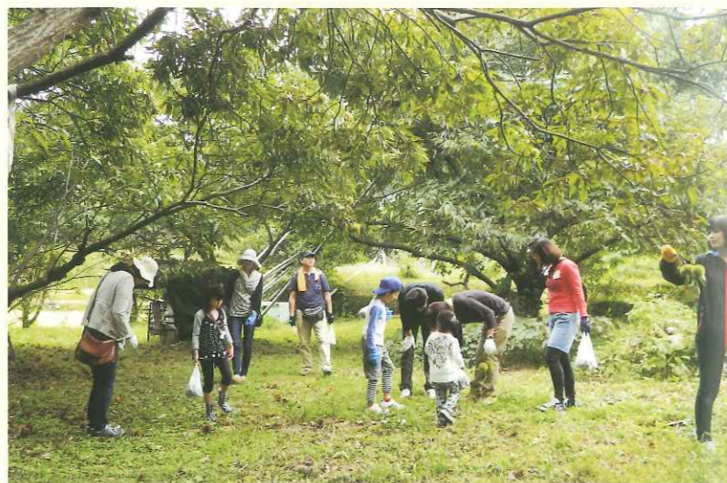
栗拾い体験の様子