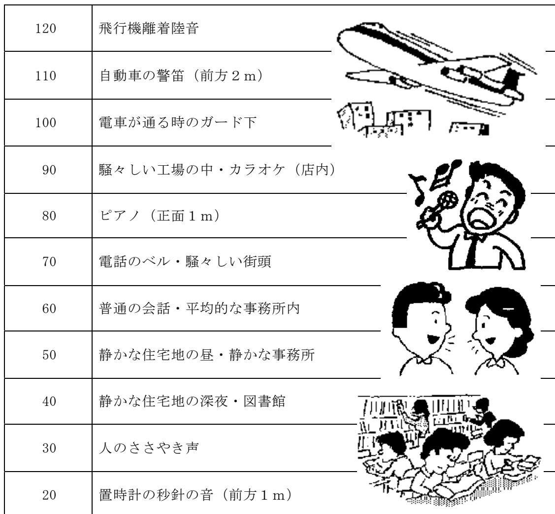
表 5-5 音の大きさのめやす (単位: dB)