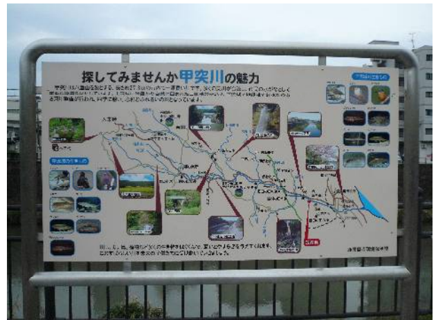
● 河川愛護意識啓発看板