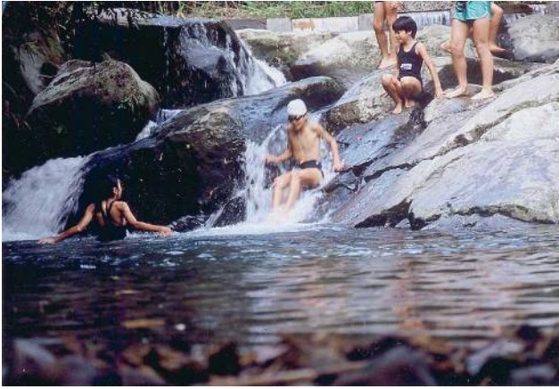
● 宮川野外活動センターでの親水