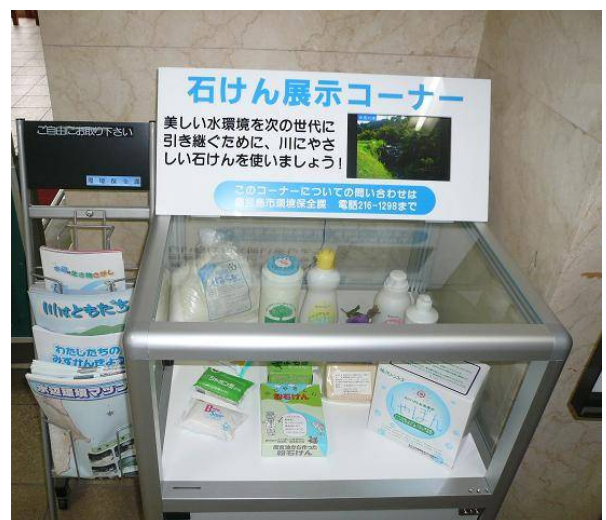
● 石けん展示コーナー(支所等に配置)