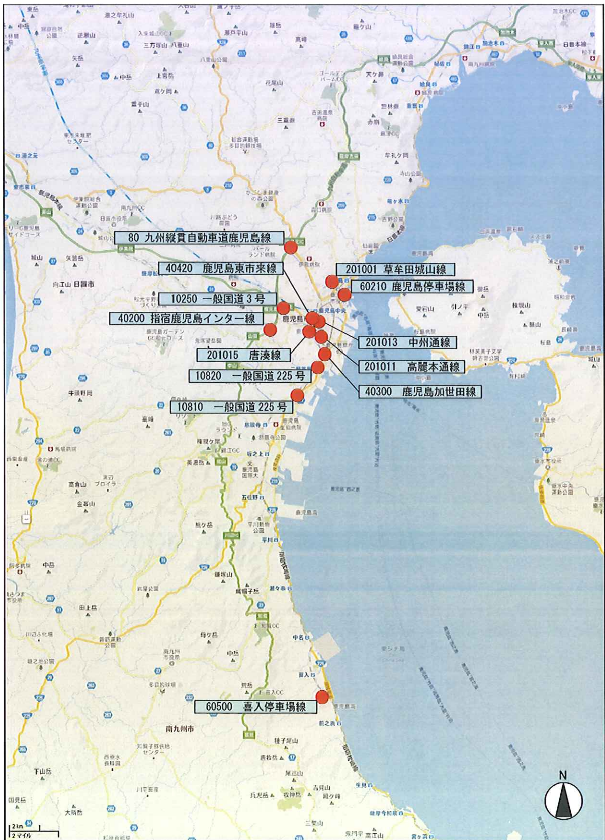
図 1-1 (1) 調査地点一覧 (道路に面する地域)