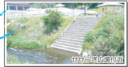
せせらぎ広場付近