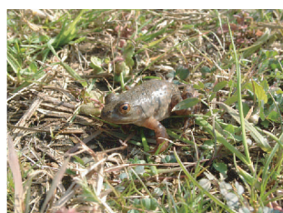
ウシガエル（特定外来生物）