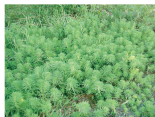
オオフサモ（特定外来生物）