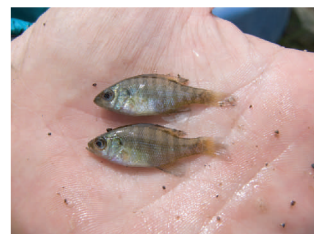
ブルーギル（特定外来生物）