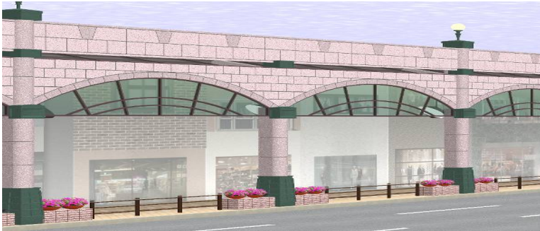
←アーケード完成予想図

1) 当該中小小売商業高度化事業が、当該中心市街地内における他の商店街等への商業活性化に係る取組にもたらす影響（当該商店街等及び当該中心市街地内における他の商店街等の来街者数の現況等）