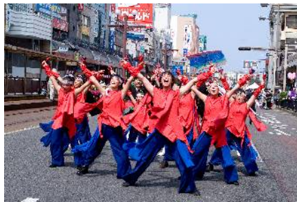
↑かごしま春祭「大ハンヤ」