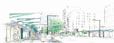
↑アーケード完成予想図

アーケード等整備事業の実施により、他の商店街等の商業活性化に係る取組にもたらす影響として、近接する商店街アーケードとの街区連携による一体的ショッピングモール化が完成し、合同イベント等の実施が可能となり、波及効果が期待される。