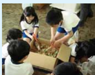
生ごみを投入して堆肥づくり