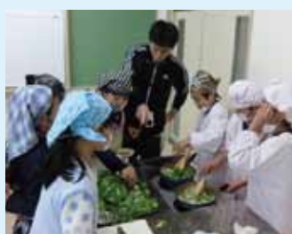
収穫した大根と白菜を調理