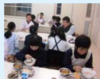
おいしくいただきました