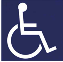
【障害者のための国際シンボルマーク】 所管：公益財団法人日本障害者リハビリテーション協会