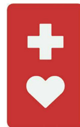
【ヘルプマーク】 所管：東京都