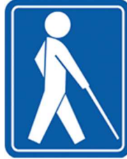
【盲人のための国際シンボルマーク】 所管：社会福祉法人日本盲人福祉委員会