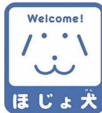
【ほじょ犬マーク】 所管：厚生労働省