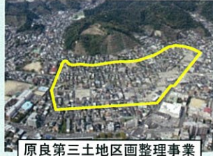
原良第三土地区画整理事業