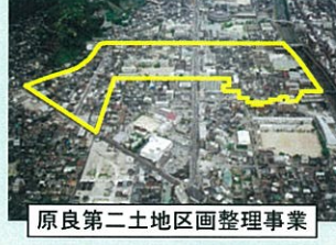
原良第二土地区画整理事業