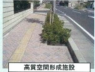
高質空間形成施設