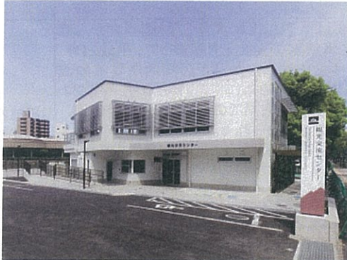
甲突川右岸・観光交流センター整備事業