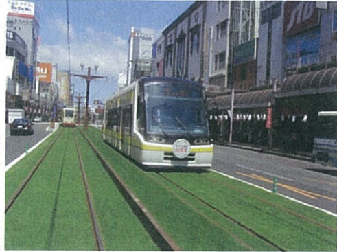
軌道敷緑化整備事業