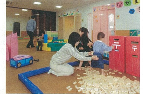
親子つどいの広場(仮称)施設整備事業