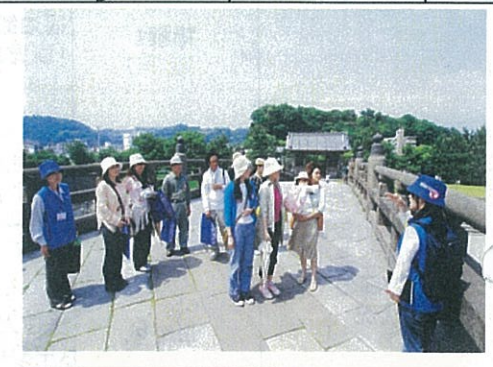
鹿児島ぶらりまち歩き推進事業