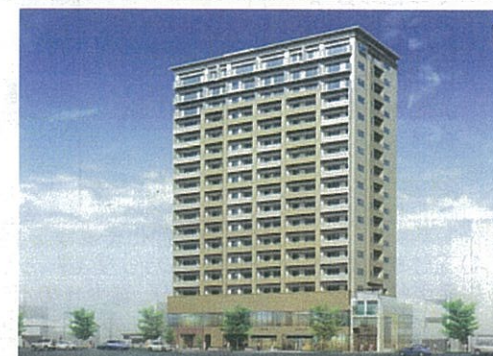
中央町23番街区市街地再開発事業

まちの課題の変化 空き店舗の解消には、商店街や各店舗が魅力を高めることで、商業集積を維持増進させることが一助となるが、一方で、需給バランスに見合った賃貸条件の設定や見直しが必要である。また、個人の財産権との兼ね合いから、商店街でもどこまで関与できるのか戸惑いもあり、今後の課題となっている。 鹿児島市都心部地区は、鹿児島中央駅地区、いづろ・天文館地区、鹿児島駅地区と大きく3つの地区に分けることができるが、それぞれの地区の置かれている状況が異なることから、地区毎のまちづくりの目標などを定め、まちづくりを進める必要がある。 今後のまちづくりの方策(改善策を含む) 整備を行った観光施設等を十分に活用するため、利用促進策などソフト事業の充実を図る。 各商店街がそれぞれの特徴を生かしたまちづくりを進めやすいように、各種支援制度の見直しを検討するとともに、地域の核となる事業者の育成に努め、商店街の強化・再生につなげる。 空き店舗対策については、商店街向けの各種支援制度の見直しを検討し、出店希望者にとって魅力ある商業関係の維持・増進を進める。 今後も、社会基盤の有効活用に努める。 盛んになったまちづくり団体が行う活動を維持するため、行政は側面的支援を行う。 鹿児島市都心部地区を構成する3地区(鹿児島中央駅地区、いづろ・天文館地区、鹿児島駅地区)について、地元住民と協議しながら、まちづくりの重点目標を定め、各事業を実施する。