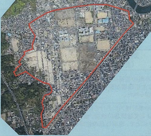
谷山第二地区土地区画整理事業 72.9ha