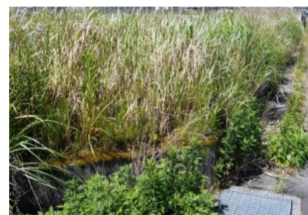
…管理されていない仮換地の様子

現在、使用していない仮換地をお持ちの方は、草刈り等の適切な維持管理をお願いします。