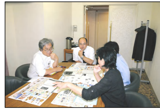
← (テーマ別マップ作成班) 熱心な検討