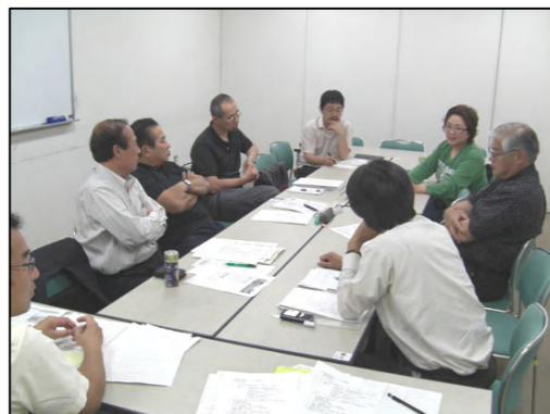
↑ (空き地・空き店舗活用分科会) 活発な検討