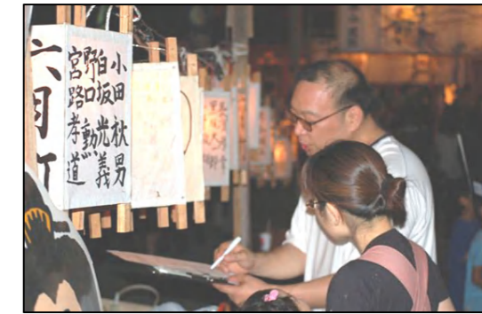
← (情報発信分科会) 六月燈でのアンケート