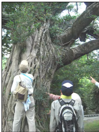
← (景観づくり分科会) 多賀山での樹木調査