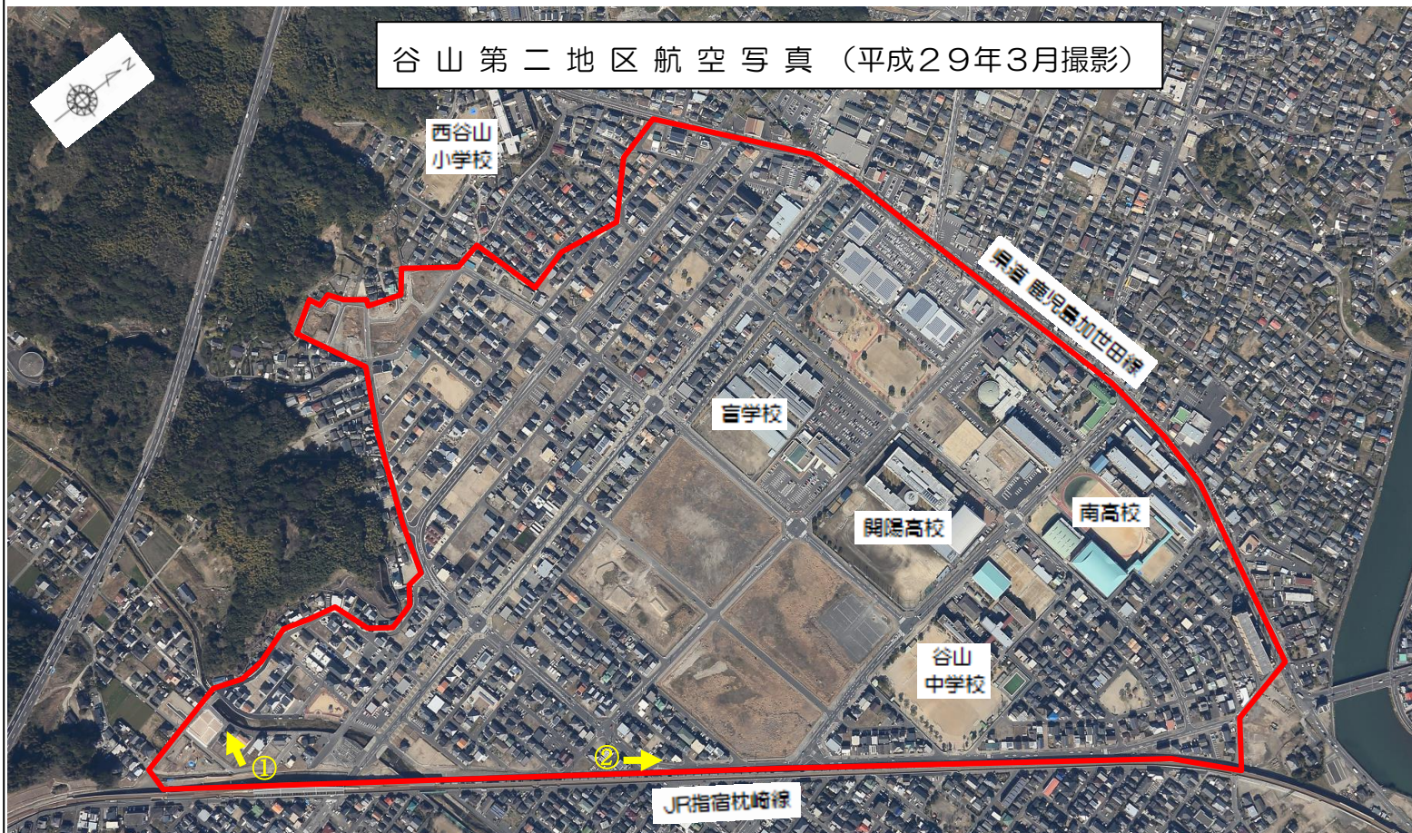
谷山第二地区航空写真(平成29年3月撮影)

谷山第二地区土地区画整理事業につきましては、平成二十八年度も皆様方のご理解とご協力をいただきながら進めてまいりました。 現在は、JR指宿枕崎線の高架化に伴う仮線路の撤去を完了し、岩下橋周辺の区画道路、敷地造成工事が完了しました。工事期間中は、通行止めなど何かとご迷惑をおかけしましたが、ご協力いただきありがとうございました。 平成二十八年度末での進捗状況は、事業費ペースで約九十九・九%となっております。