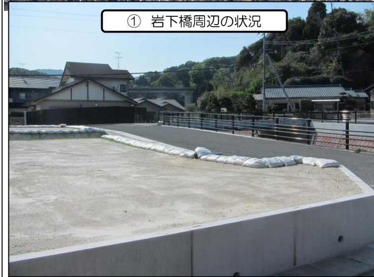
① 岩下橋周辺の状況