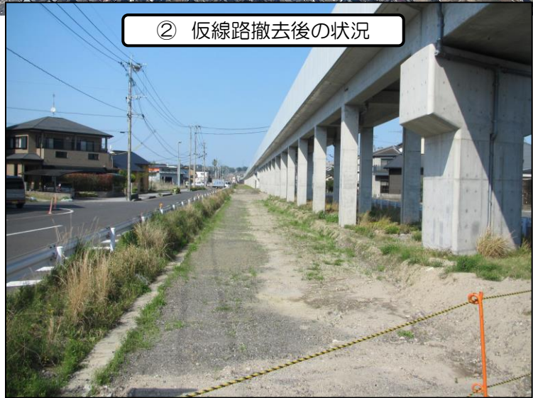
② 仮線路撤去後の状況