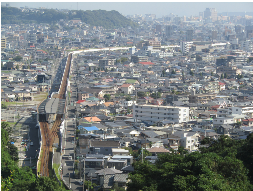
写真 5-1 谷山神社から高架化区間を臨む