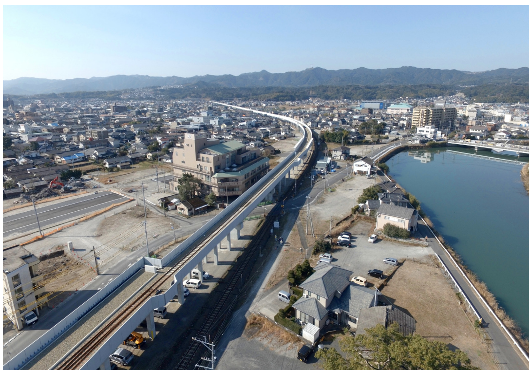
写真 5-2 谷山駅付近から慈眼寺方面を臨む