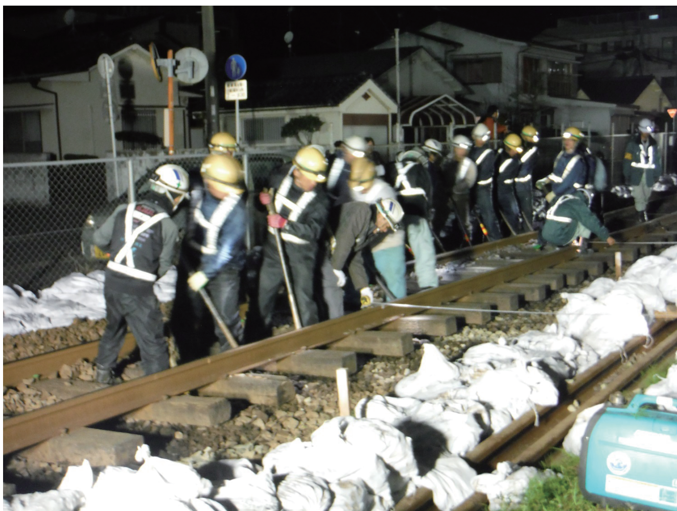
高架切替前夜の軌道切替