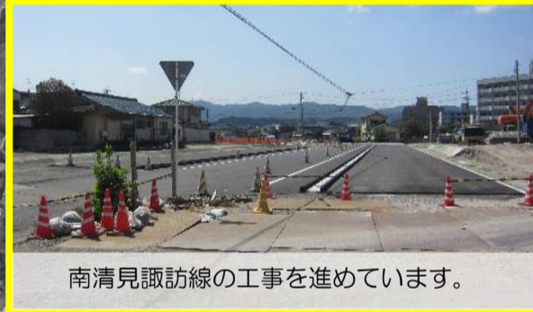
南清見諏訪線の工事を進めています。