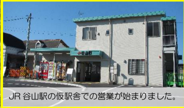
JR 谷山駅の仮駅舎での営業が始まりました。