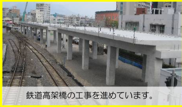
鉄道高架橋の工事を進めています。