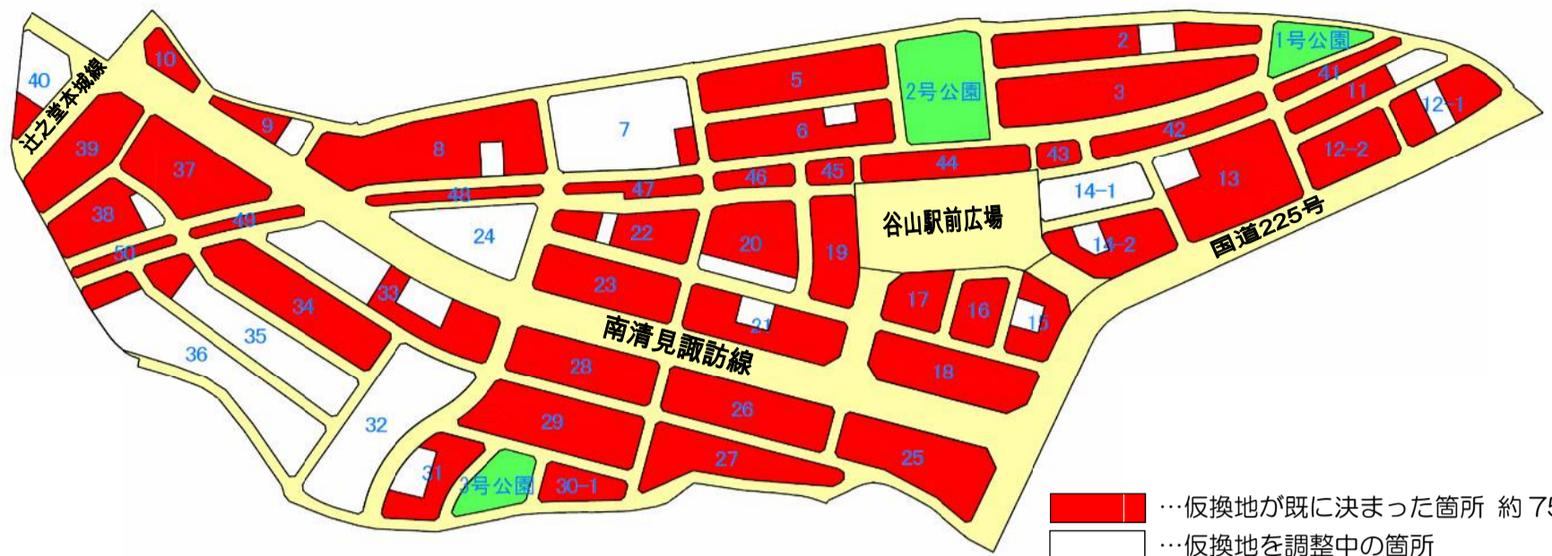
仮換地指定状況図(平成26年5月1日時点)

■ …仮換地が既に決まった箇所 約75% ■ …仮換地を調整中の箇所 ■ …道路 ■ …公園