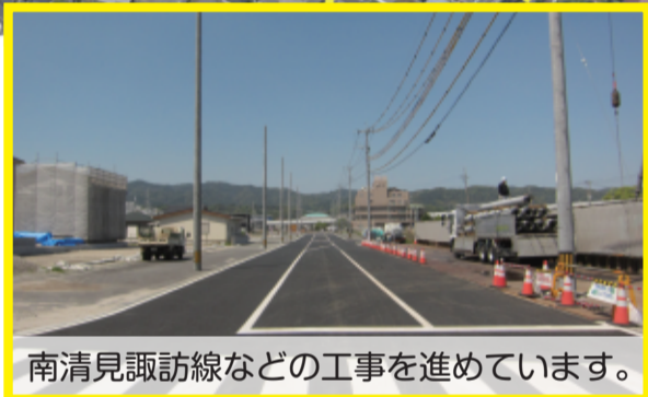
南清見諏訪線などの工事を進めています。