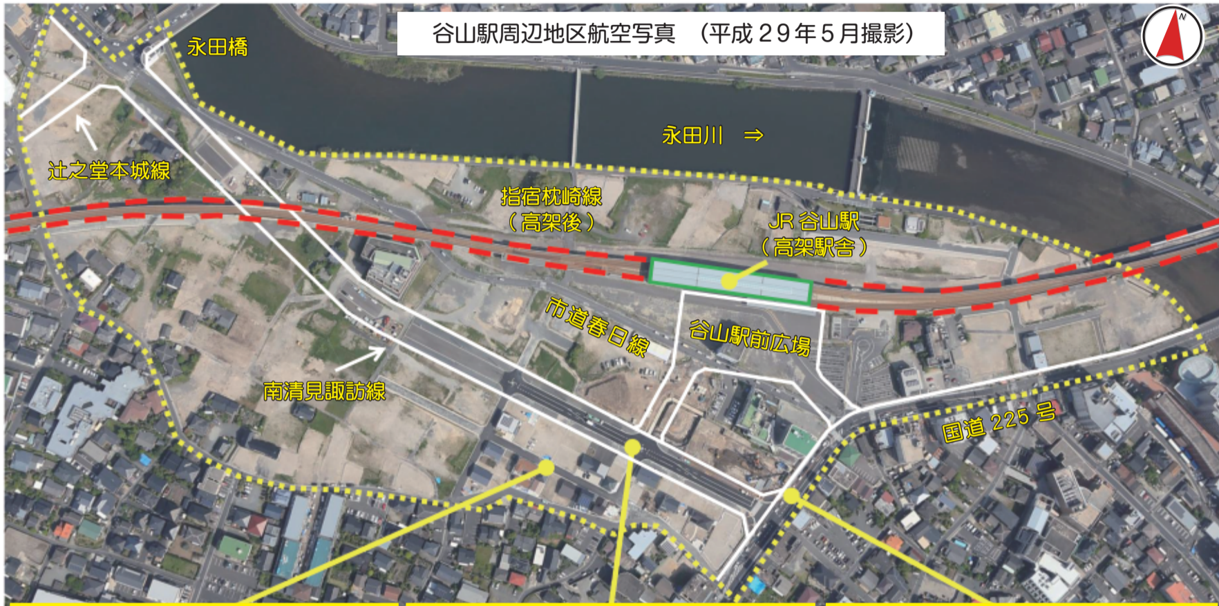
谷山駅周辺地区航空写真 (平成29年5月撮影)