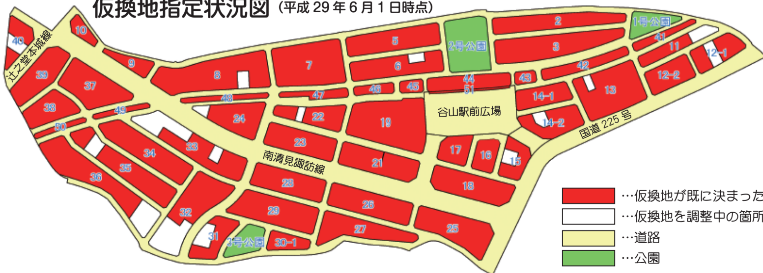
仮換地指定状況図 (平成29年6月1日時点)

初夏の頃、皆様いかがお過ごしでしょうか。さて、平成28年度も皆様のご理解とご協力をいただきながら、仮換地に関する協議や、建物移転に関する協議を進めることができました。仮換地指定率は約93%となり、整備完了箇所から順次、仮換地をお返しし、仮換地への新しい住宅の建築も進んでおります。仮換地をお返しできないところにつきましても、仮換地をできる限り早くお返しできるように努めてまいります。 工事については、幹線道路「南清見諏訪線」、その周囲の区画道路、宅地整地の工事を随時進めてまいりました。また、国道225号につきましても、平成28年度に区域の南側から整備を進めており、平成29年度中に工事完了する予定になっております。 また、谷山駅付近の高架下の一部には、今年度、駐輪場を整備する予定となっております。 今年度も、建物移転等の協議を進めるとともに、道路工事などをおこない、電気、水道などのライフラインの整備を進めてまいります。周囲の方々には大変ご迷惑をおかけしますが、事業の早期完了に向け、より一層、努力してまいりますので、引き続きご協力をよろしくお願いいたします。