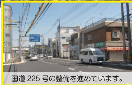
国道225号の整備を進めています。