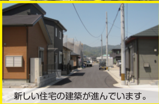
新しい住宅の建築が進んでいます。