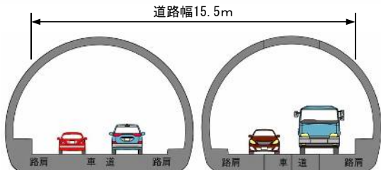
地下式 断面イメージ (トンネル部)