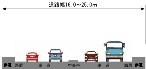
地表式 断面イメージ (土工部)