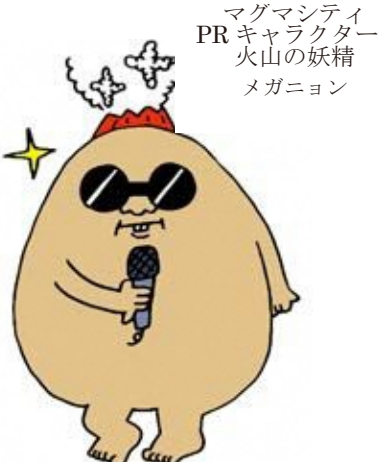
マグマシティ PR キャラクター 火山の妖精 メガニョン