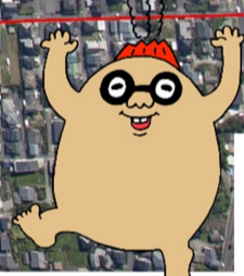
マグマシティ PRキャラクター 火山の妖精 マグニオン