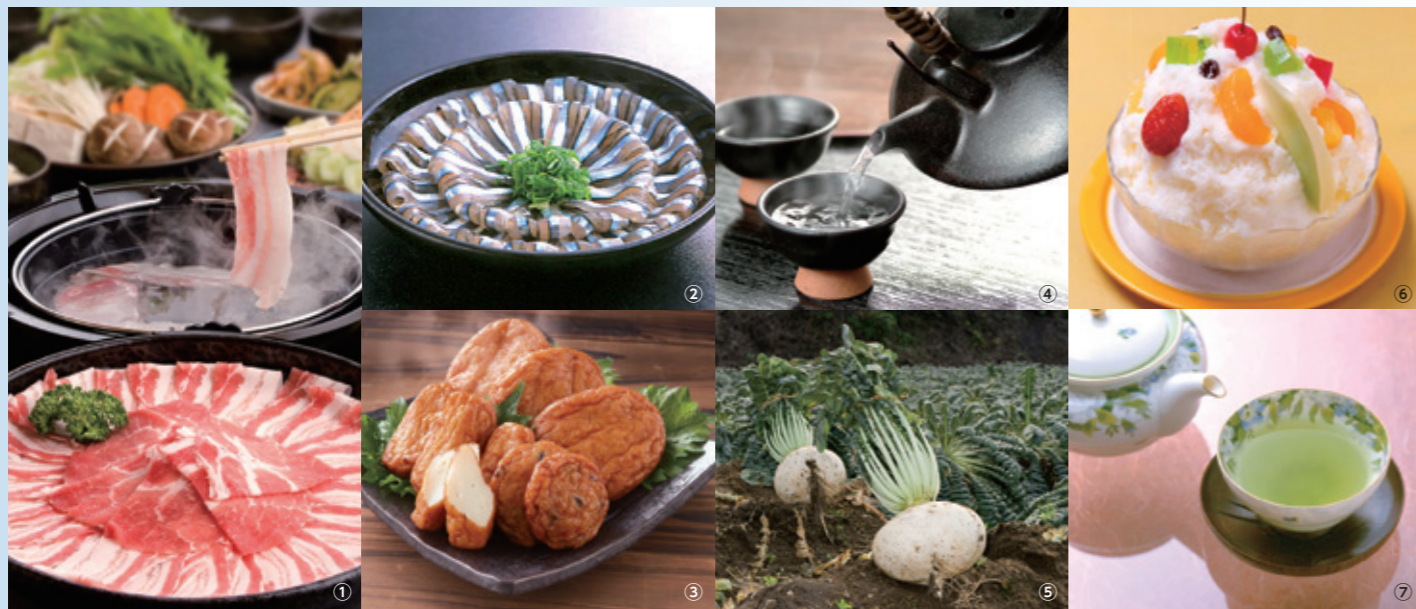
① 흑돼지·흑우 요리 ② 셋줄멸 회 ③ 사쓰마아게 ④ 소주 ⑤ 사쿠라지마 무 ⑥ 시로쿠마 ⑦ 차

온난한 기후와 풍요로운 자연의 혜택을 받은 가고시마는 먹거리의 보고입니다. 예부터 중국 대륙, 류큐의 영향을 받으면서 독자적인 식문화를 키워 왔습니다. 일본 최고의 와규에 빛나는 가고시마 흑우와 가고시마 브랜드의 흑돼지, 셋줄멸 및 잿방어 등의 해산물, 생산량 일본 최고인 고구마와 제2위인 차, 활화산 사쿠라지마에서 기르고 세계에서 가장 무거운 무로 기네스북에 등재된 사쿠라지마 무 등 진정한 맛을 만끽할 수 있습니다.