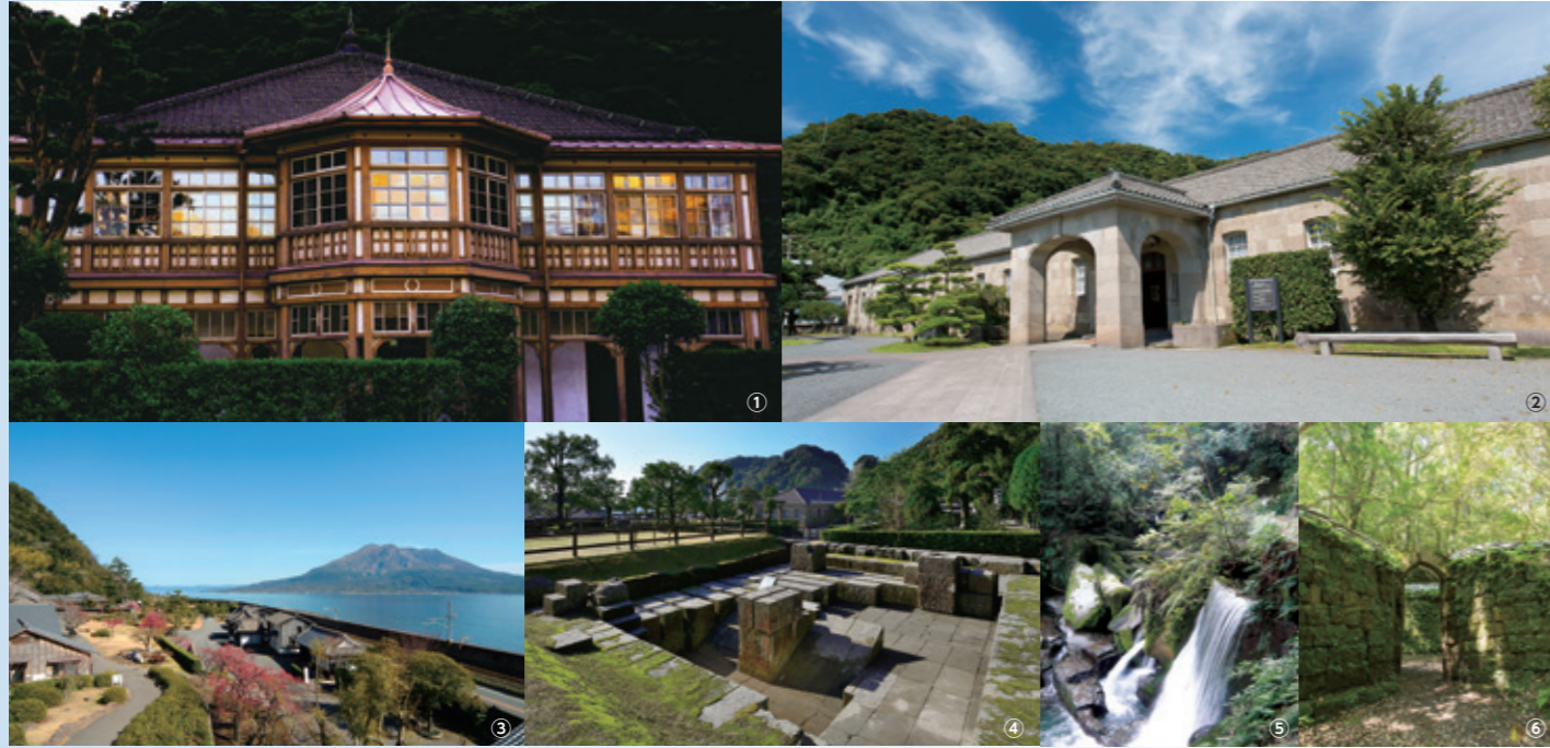
① 구 가고시마 방적소 기사관(이인관) ② 구 집성관 기계 공장 ③ 센간덴 ④ 반사로 터 ⑤ 세키요시 수로 ⑥ 데라야마 숯가마 터

일본의 에도 시대(1603년~1867년) 말기, 당시에 가고시마 지역을 다스리고 있던 사쓰마번의 명군·시마즈 나리아키라는 유럽과 미국 열강의 아시아 진출에 위기감을 안고 산업과 군비의 근대화를 도모하기 위해 제철 및 유리 등의 제조를 비롯하여 함선 건조, 대포 등의 무기 제조 및 증기 기관, 전신, 사진 등의 기술 개발에 이르기까지 폭넓게 연구, 제조를 시도했습니다. 집성관 사업이라 불리는 그 대사업은 일본의 산업 혁명을 이끈 선구적인 역할을 수행했으며, 당시를 증언하는 가고시마시의 구 집성관, 데라야마 숯가마 터, 세키요시 수로는 세계 문화 유산에 등재된 '메이지 일본의 산업 혁명 유산 제철·제강, 조선, 석탄 산업'을 구성하는 자산으로 자리 잡고 있습니다.