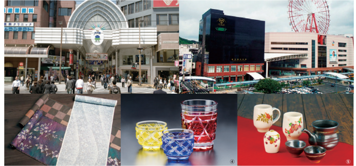
① 덴몬칸 ② 가고시마 주오역 ③ 본고장 오시마 명주 ④ 사쓰마 기리코 ⑤ 사쓰마 도자기

가고시마의 메인 스트리트 “덴몬칸” 및 신칸센의 일본 최남단 발착역으로, 교통·상업 기능이 집적된 가고시마 주오역 주변은 많은 시민과 관광객으로 북적이고 있습니다. 또한 가고시마시는 음식·숙박업 등을 비롯한 관광 산업, 가고시마의 풍요로운 식재료를 취급하는 도매·소매·제조업, 의료·복지업 등의 산업이 집적된 활기 넘치는 도시입니다. 또한 본고장 오시마 명주 및 사쓰마 기리코, 사쓰마 도자기, 사쓰마 석기, 대나무 제품, 야쿠 삼나무 제품 등의 전통 산업에서도 장인의 기술이 계승되고 있습니다.