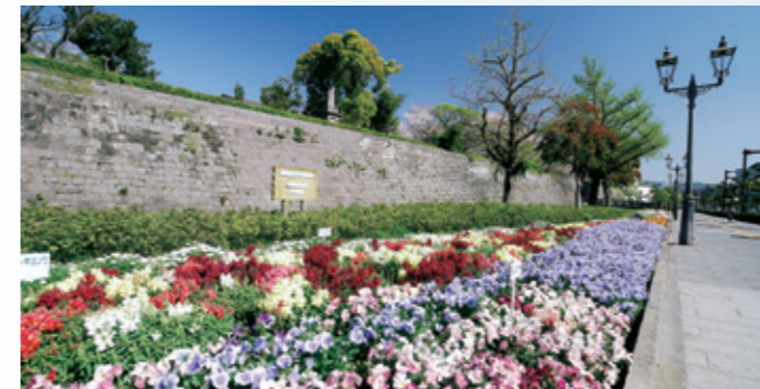
統治鹿兒島約700年的島津家的城堡「鶴丸城遺跡」

在市內移動極為方便的路面電車。經由軌道綠化而誕生的長約8.9km、面積約35,000m 2 的綠色地毯開創出潤澤舒適的空間，獲得了2012年亞洲都市景觀獎的殊榮。