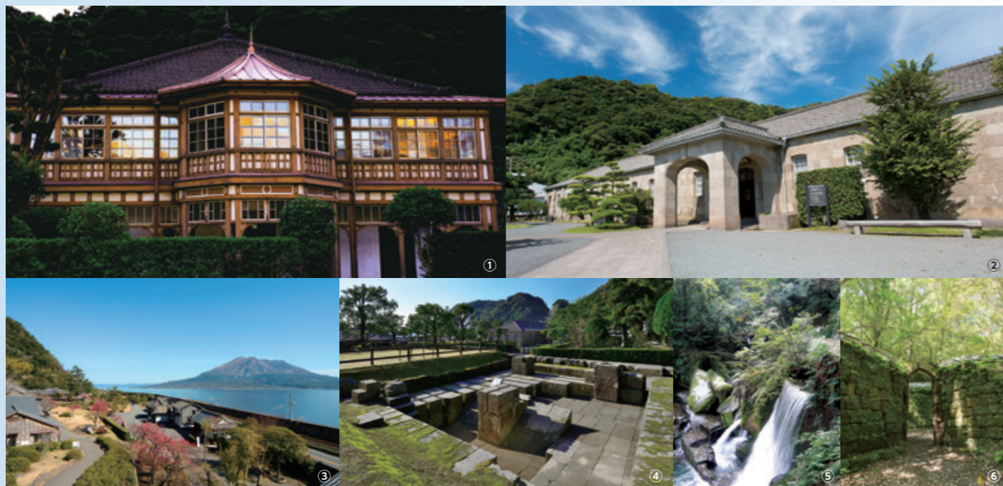
①舊鹿兒島紡織所技師館（異人館） ②舊集成館機械工廠 ③仙巖園 ④反射爐遺址 ⑤關吉水渠 ⑥寺山炭窯遺址

統稱為集成館事業的這項大事業是日本產業革命的先驅，說明當時情景的鹿兒島市舊集成館、寺山炭窯遺址、關吉水渠都是被列入世界文化遺產名錄的「明治日本的產業革命遺產 製鐵、製鋼、造船、煤炭產業」的組成部分。