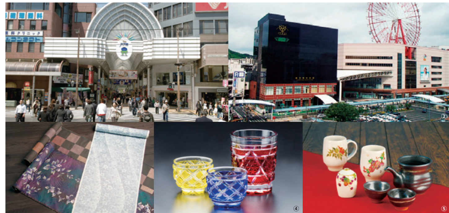
①天文館 ②鹿兒島中央站 ③正宗大島網 ④薩摩切子（彩色玻璃） ⑤薩摩燒

此外，正宗大島網和薩摩切子（彩色玻璃）、薩摩燒、薩摩錫器、竹製品、屋久杉製品等傳統產業的專家技術也一路傳承至今。