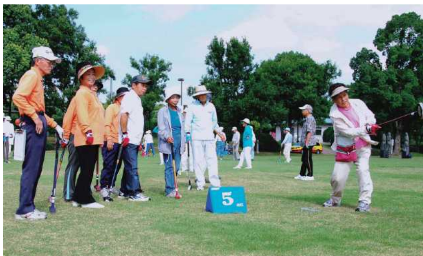
長才まつりグラウンド・ゴルフ大会