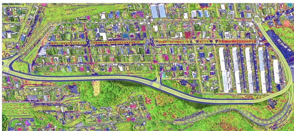
武武岡線(2期)イメージ図

これまで整備してきた武武岡線(2期)が完成するほか、高麗通線(2期)、宇宿広木線(2期)及び谷山支所前通線の用地取得や道路築造工事等を進めます。