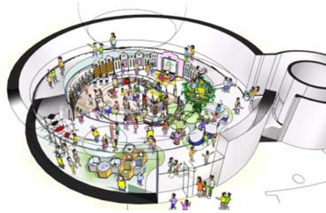
メルヘン館リニューアルイメージ図