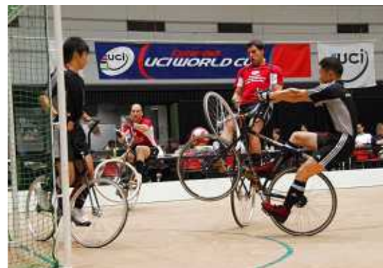
サイクルサッカー

23年11月に本市で開催する世界室内自転車競技選手権鹿児島大会に向けた準備を行います。