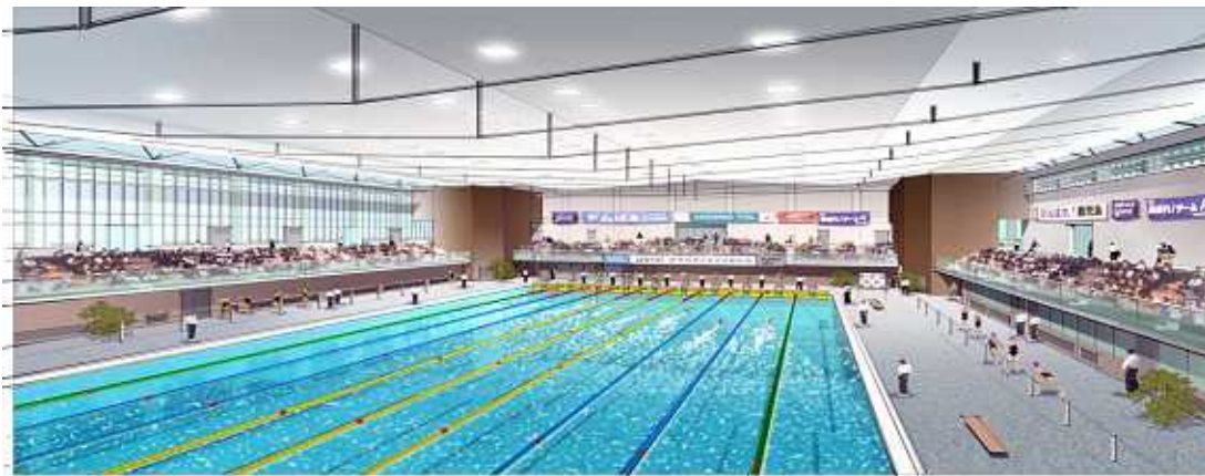
新鴨池公園水泳プール完成イメージ図

23年4月の供用開始を目指し、引き続きPFI事業者により、新鴨池公園水泳プールの整備を行います。