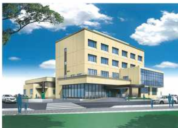
すこやか子育て交流館イメージ図