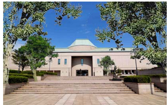
植樹後のイメージ図

美術館の開館25周年を記念し、特別企画展を開催するとともに、福岡市、熊本市との三市連携によるアジアの近・現代美術展を開催するほか、前庭に植樹による緑陰空間を創出します。