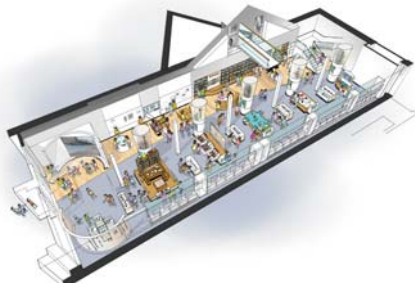
近代文学館リニューアルイメージ図

展示施設の全面改修を行い、子どもから大人まであらゆる世代が、さらに興味を持ち、魅力を感じる施設として、23年3月にリニューアルオープンします。