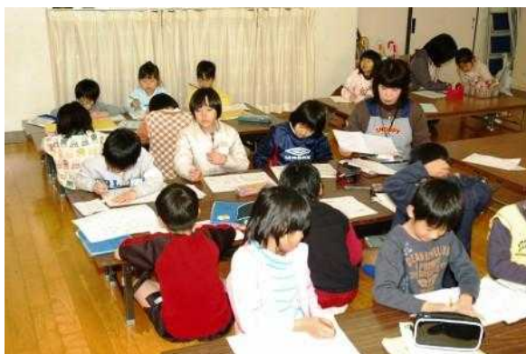
児童クラブで仲良く勉強