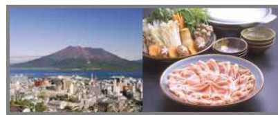
鹿児島市ふるさと大使

本市の魅力を広く全国に紹介・宣伝するとともに、一層のイメージアップを図るため、県外で活躍している本市出身者等を新たにふるさと大使として委嘱します。