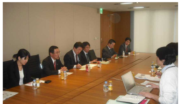
<韓国でのトップセールスの様子>

東アジア地域からの海外観光客誘致のため、トップセールスや関係機関と連携した誘致セールスを行うとともに、受入体制の更なる充実を図ります。