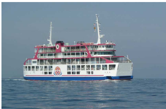
<新桜島丸(サクラエンジェル)>

桜島と錦江湾の魅力を海上から身近に楽しむことのできるクルーズとして、鹿児島港から神瀬を周り桜島港へ至る約50分の「よりみちクルーズ船」を、年末年始を除き毎日運航します。