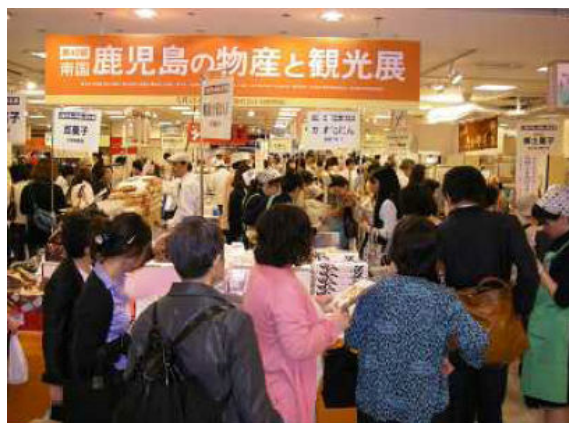
〈大丸神戸店での物産観光展の様子〉

特産品の販路拡大及び観光客誘致を図るため、神戸市及び福岡市で物産観光展を開催します。