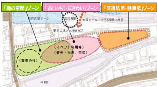
ゾーニングイメージ

鹿児島駅周辺整備計画の事業実現に向けた施設の検討や関係機関等との協議を行うとともに、土地利用基本計画に基づき施設基本計画の作成等を行います。