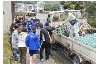
資源物の回収活動