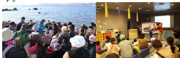
市民活動団体等の保全活動状況

生物多様性地域戦略に基づき、市民活動団体等の自主的、継続的な保全活動の支援等を行います。