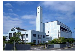
現在の南部清掃工場

南部清掃工場のごみ焼却施設とバイオガス施設との一体整備に向け、事業者選定のための要求水準書作成などを行います。