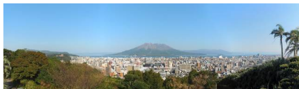
武岡公園予定地からの眺望