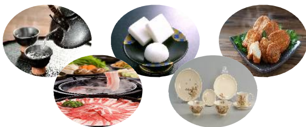
(お礼品のイメージ)

寄附申込手続きにクレジット決済を導入するとともに、お礼品を拡充し、更なるふるさと納税の推進を図ります。