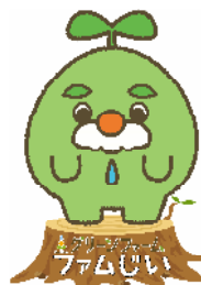
グリーンファーム マスコットキャラクター

マスコットキャラクター「ファムじい」を活用したPRや季節ごとのイベントを充実するほか、新たに観光農業公園に地域おこし協力隊を配置し、グリーン・ツーリズムのさらなる推進を図ります。