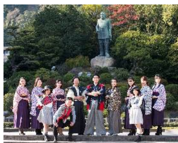
まちなかおもてなし隊