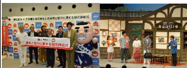
吉本興業との協定締結(H29.12)