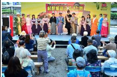
薩摩維新ふるさと博

明治維新150周年を記念し、大河ドラマ「西郷どん」と連動して、ドラマ出演者を招へいた新たなイベントや薩摩維新ふるさと博などを、ドラマ館周辺等をメインエリアとして開催するほか、市内各所で幕末・維新期の雰囲気を感じられるおもてなしの充実を図ります。