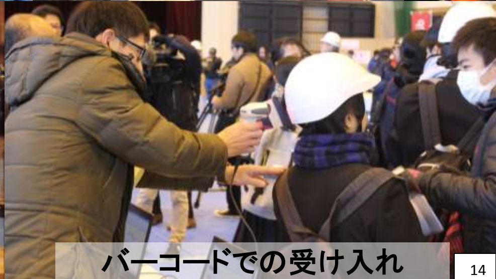
バーコードでの受け入れ