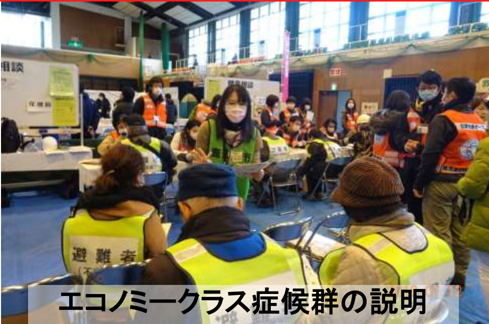
エコノミークラス症候群の説明