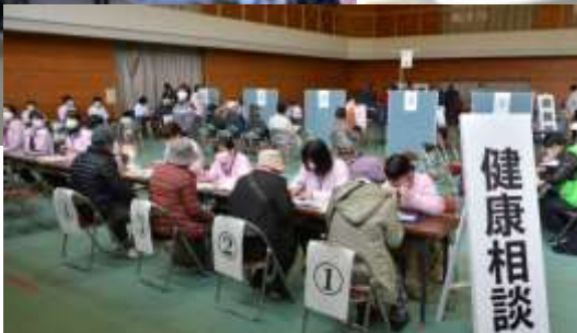
健康相談・メンタルヘルスケア