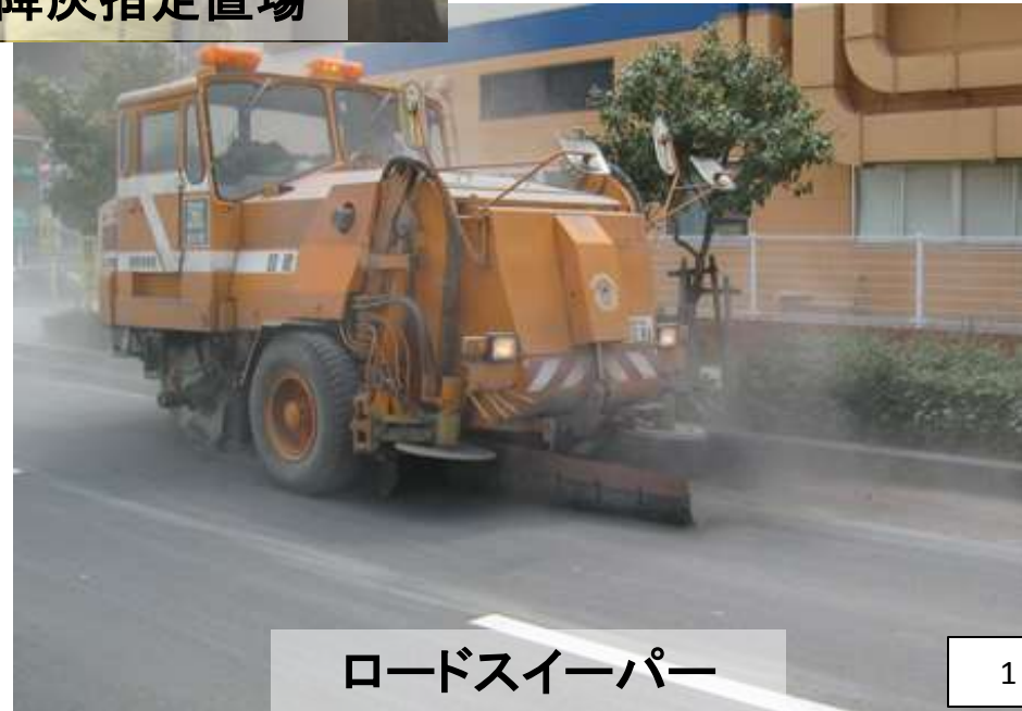
ロードスイーパー