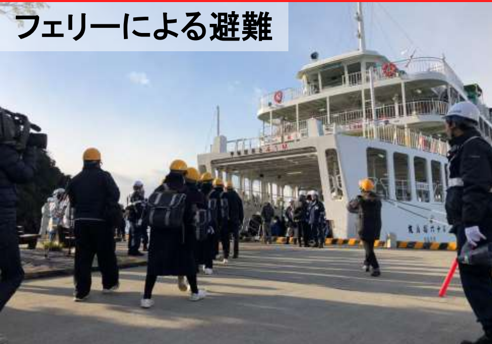
フェリーによる避難