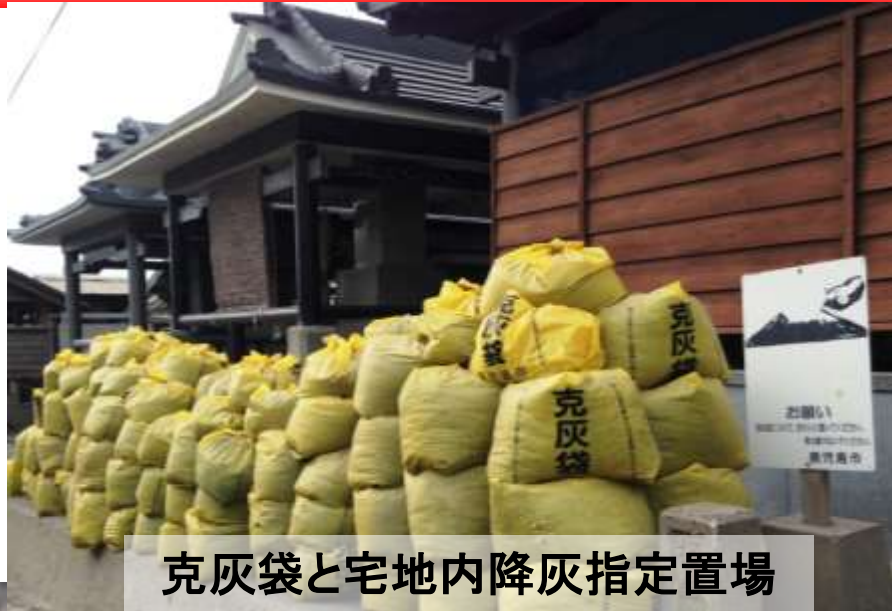
克灰袋と宅地内降灰指定置場