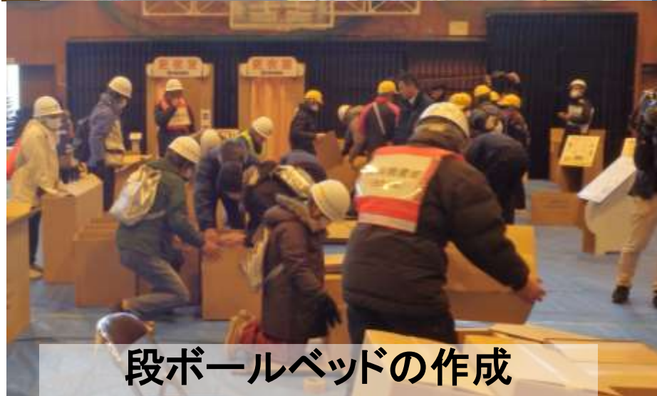
段ボールベッドの作成