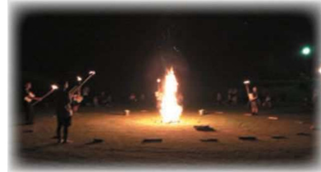
キャンプファイヤー場