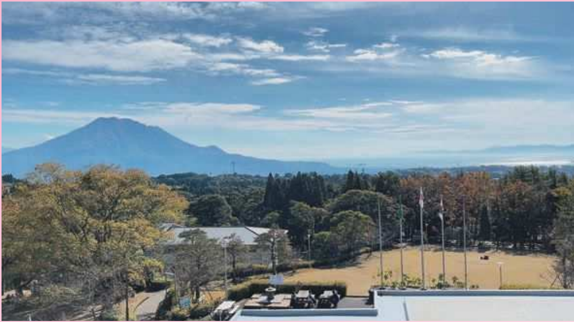
本館屋上から望む桜島