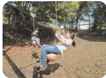
ミニアスレチック