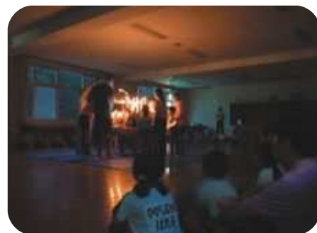
キャンドルセレモニー