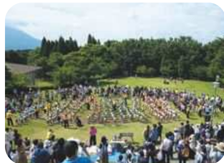
親子ふれあい活動