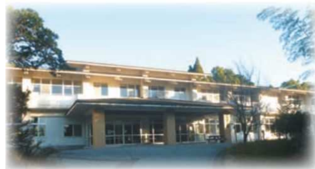
研修や宿泊ができる学習棟