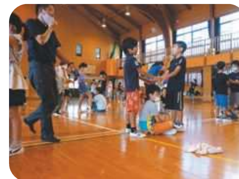
出前講座(レクリエーション)