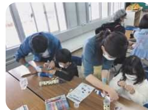
出前講座(創作活動)