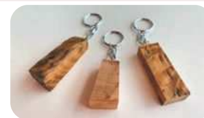
木のキーホルダー