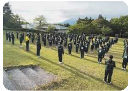
朝のつどい(つどいの広場)