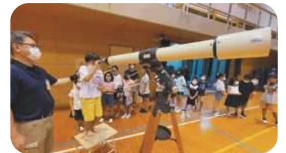
出前講座(天体観望)