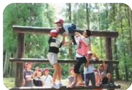
グループチャレンジゲーム