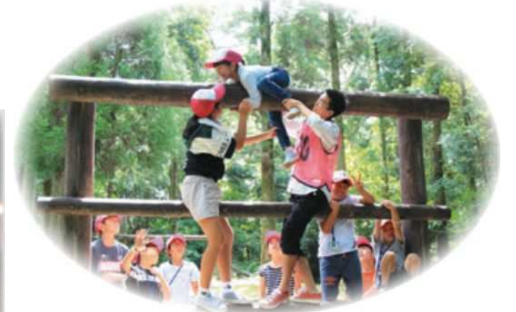
野外活動施設 (グループチャレンジゲーム)