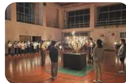
キャンドルセレモニー