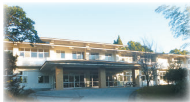
研修や宿泊ができる学習棟