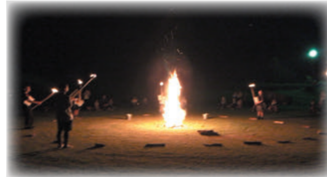
キャンプファイヤー場