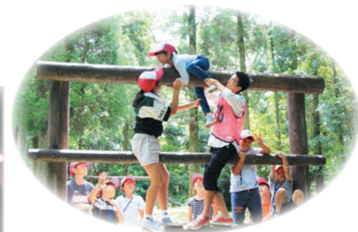
野外活動施設 (グループチャレンジゲーム)