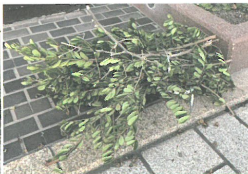
葉付きの枝 ※葉の割合が多いものも対象