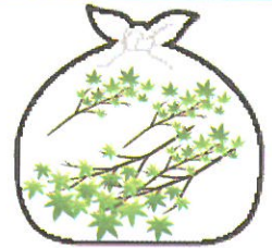
45リットルまでの 透明ごみ袋