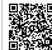
パートナーシップ宣誓制度