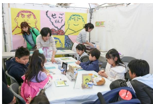
フォトフレームづくり