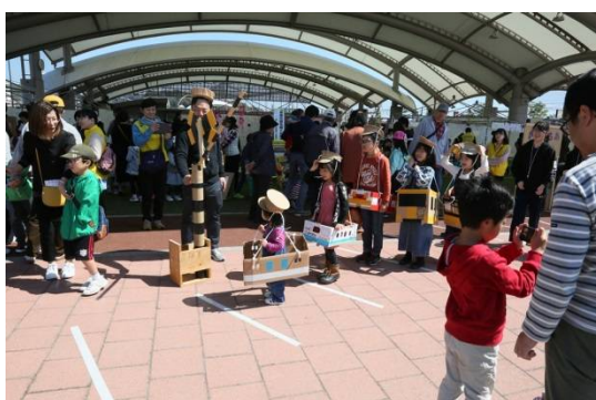
D（ダンボール）列車で行こう！