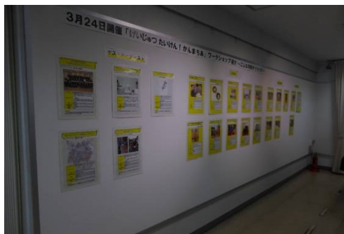
げいじゅつたいけん！かんまちあ予告展