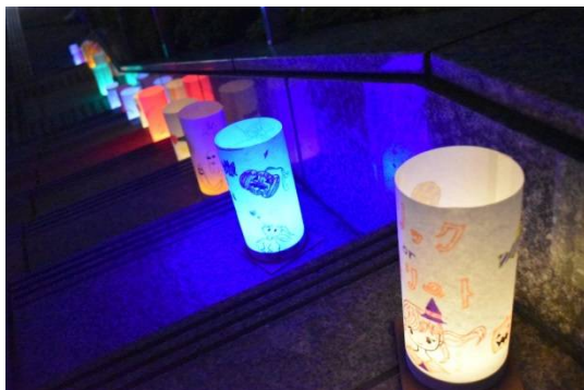
会場周辺の通りに和紙あかりを展示