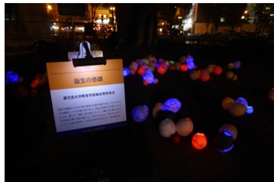
「誕生の奇蹟」と題したあかり (照國公園)