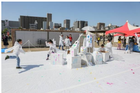
みんなで創るストレス発散アート