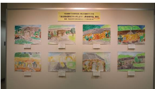
尚古集成館スケッチ作品