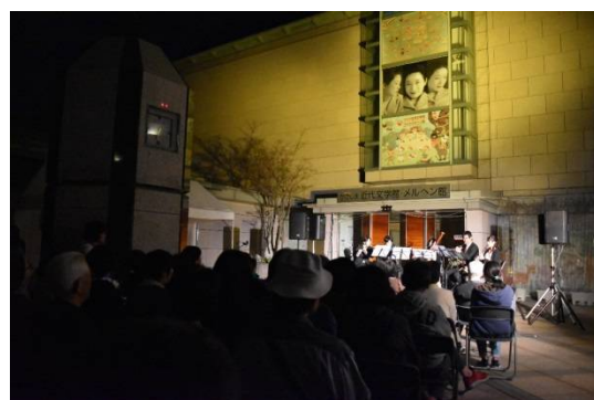
近代文学館・メルヘン館ステージ