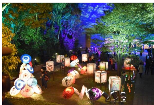
和傘のオブジェ、灯籠(鹿児島市立美術館前庭)