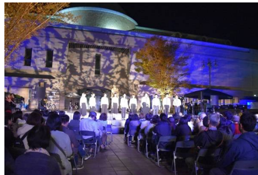
鹿児島市立美術館前庭での音楽ステージ