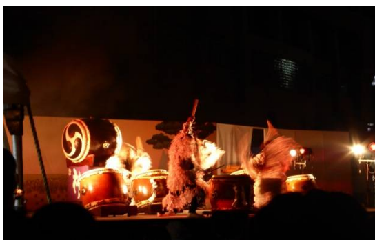
ふるさとの秋祭り(照國公園)