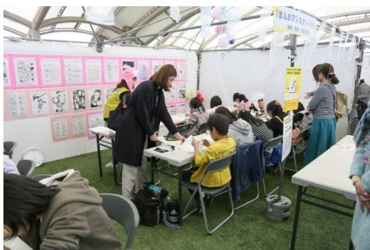
まんがアシスタント体験