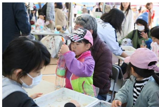
開拓！カンマチア文明（マラカス作り）