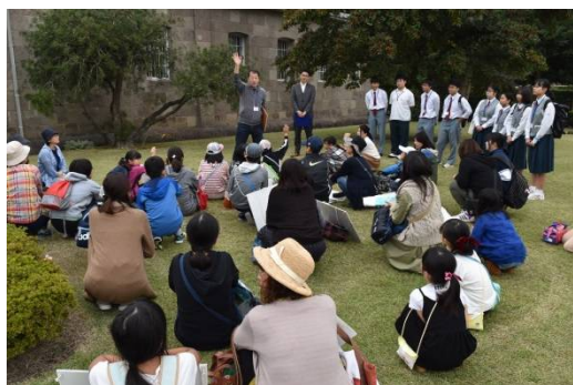
全体ミーティング