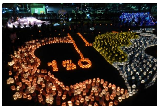
明治維新 150 周年をテーマにしたあかり(探勝園)