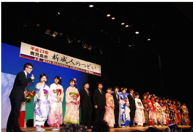
平成23年新成人のつどい

思い出コーナー(中学校等紹介)、恩師などからのメッセージコーナー、呈茶、着物着付け直し