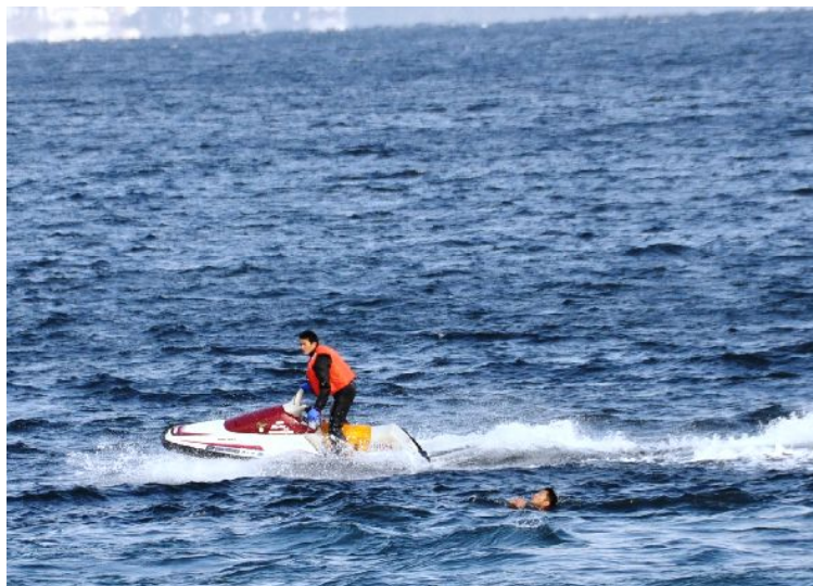
県警による水難者救出救護訓練(昨年の訓練)