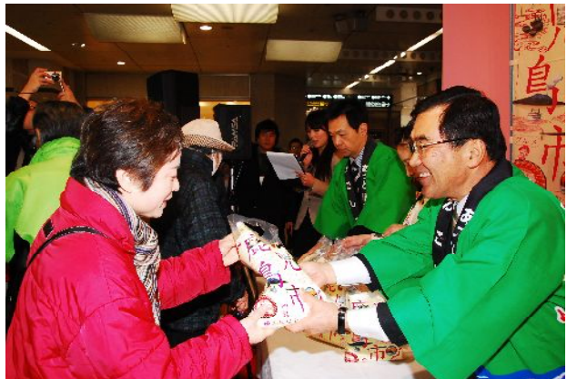
2011鹿児島県の物産と観光展(市長トップセールス)

南国鹿児島県の物産と観光展実行委員会 (鹿児島県市、(財)鹿児島県観光コンベンション協会)