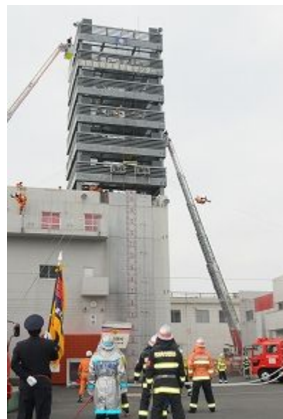
平成23年鹿児島市消防出初式