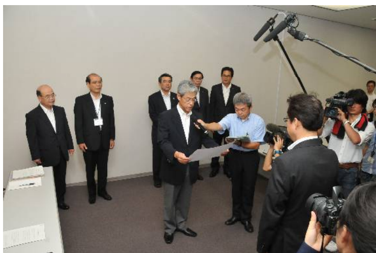
安全協定の締結に関する要請書の提出（7月13日）