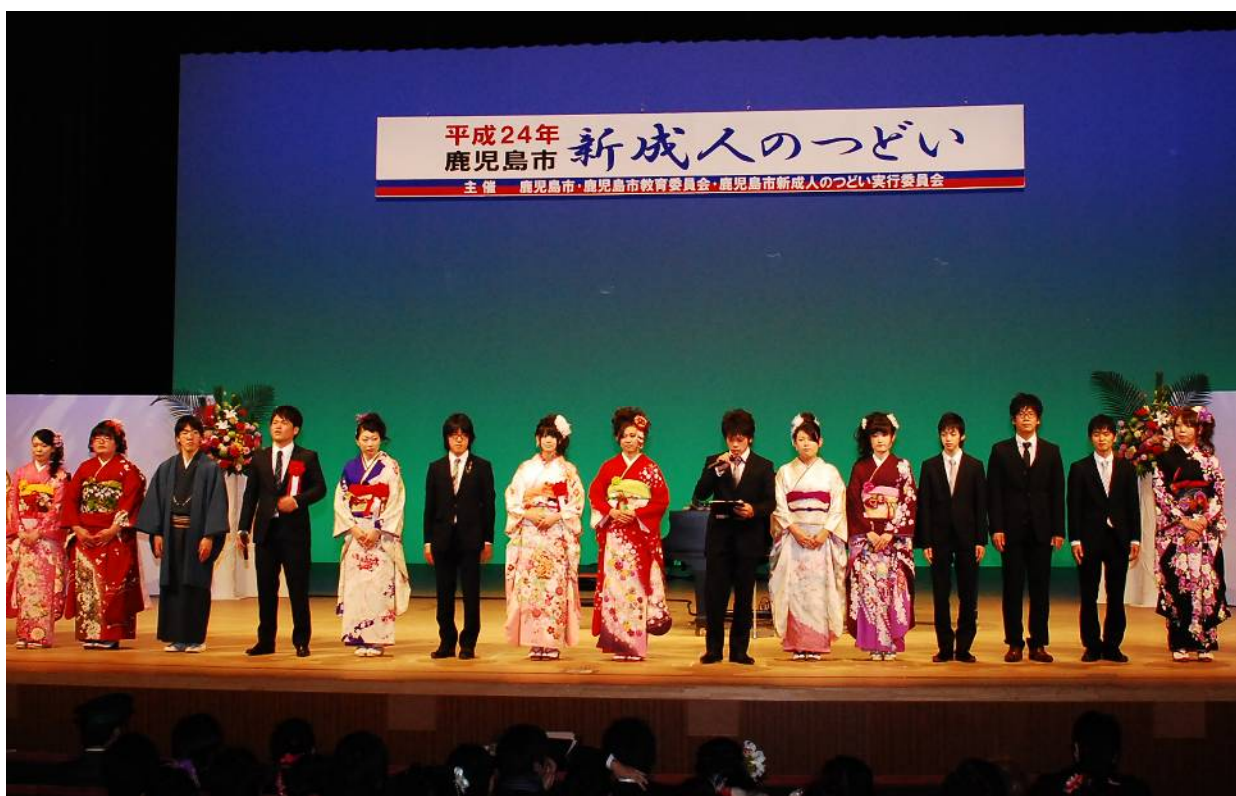
平成24年「新成人のつどい」