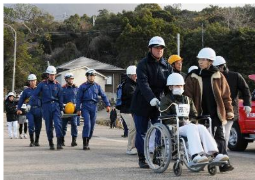
平成23年度桜島火山爆発総合防災訓練 (1月12日)