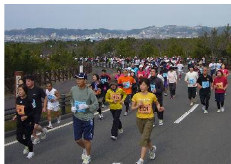
第32回ランニング桜島大会 (2月26日)