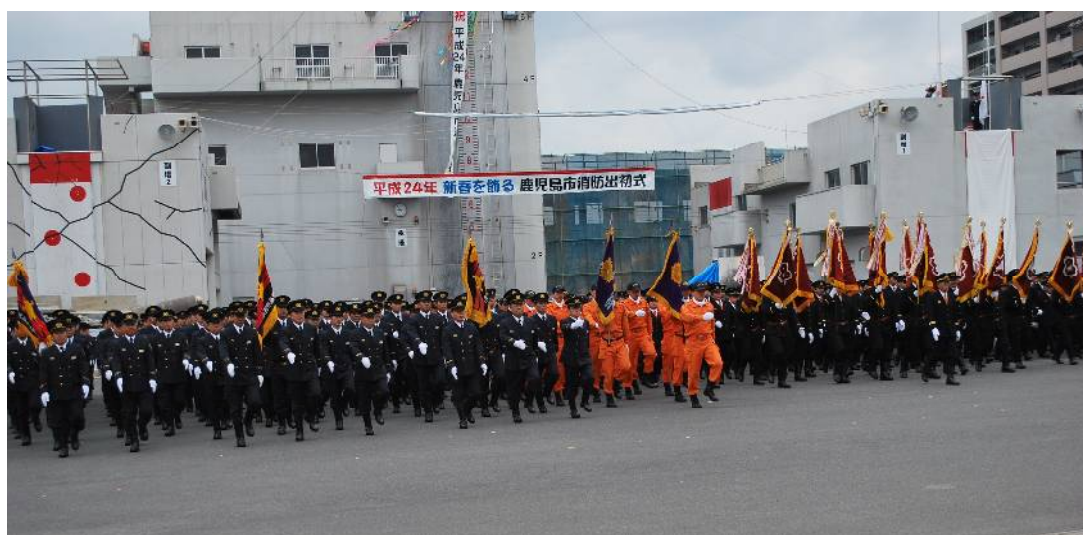
平成24年鹿児島市消防出初式（1月8日）