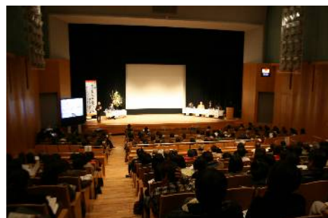
平成23年度生涯学習フェスティバル (2月4日)

宮川泰夫氏(元NHKアナウンサー)の生涯学習講演会、勝間和代氏(経済評論家)の男女共同参画講演会、佐久間レイ氏(声優・歌手・脚本家)のトークコンサート など ※生涯学習の推進と男女共同参画社会の実現に向けて、市民相互の情報発信や交流を図るため、昨年度まで同時期に別々で開催していた「生涯学習フェスティバル」と「男女共同参画フェスティバル」を、本年度から「サンエールフェスタ」と名称を変更し、共同で開催