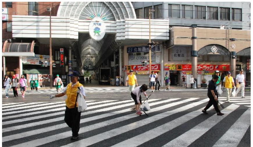
昨年の天文館クリーン大作戦