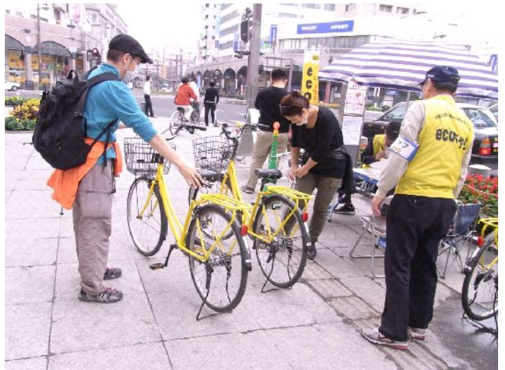
昨年の社会実験の様子

複数のサイクルポート(自転車の貸出拠点施設)を配置し、どのサイクルポートでも貸出・返却ができる自転車の共同利用システムのこと