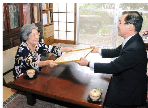
昨年の市長の敬老訪問