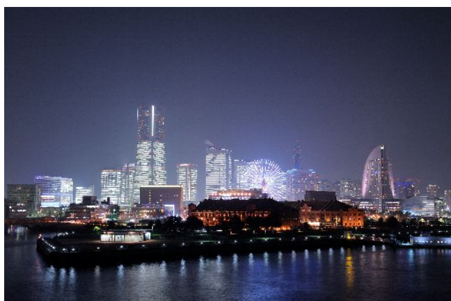
みなとみらい地区(横浜市)