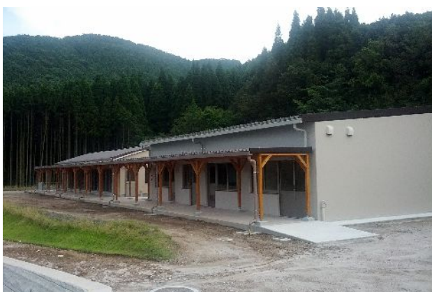
循環型農業の仕組みを学ぶ環境学習棟