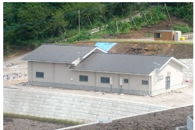
農作物の収穫後の作業などを行う作業棟