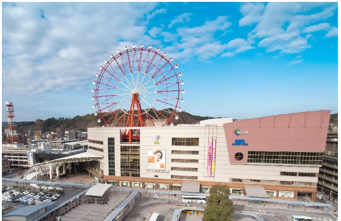
本市初の津波発生時の緊急一時的な避難施設として指定されるアミュプラザ鹿児島