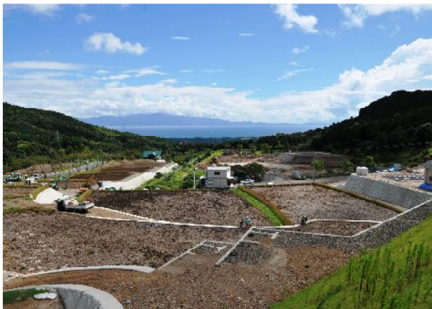
整備が進む体験用農地