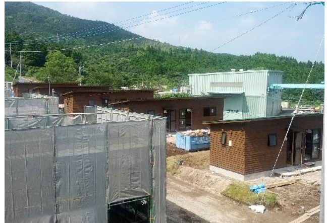
簡易宿泊所を備えた滞在型市民農園