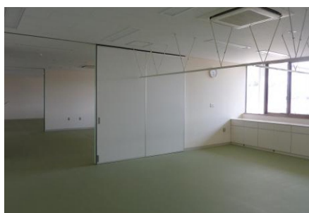
新南部保健センターの内観 (左：ホール、右：診察室)