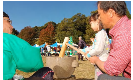
農林水産秋まつりでの餅つき体験