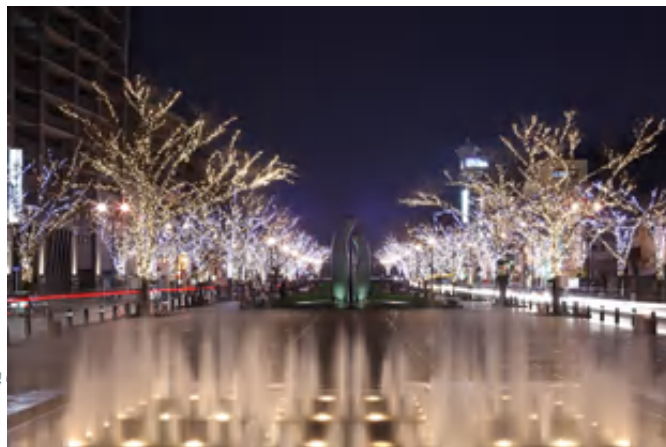
冬のイルミネーション (みなと大通り公園)