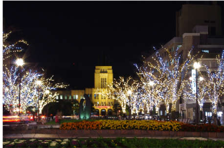
みなと大通り公園