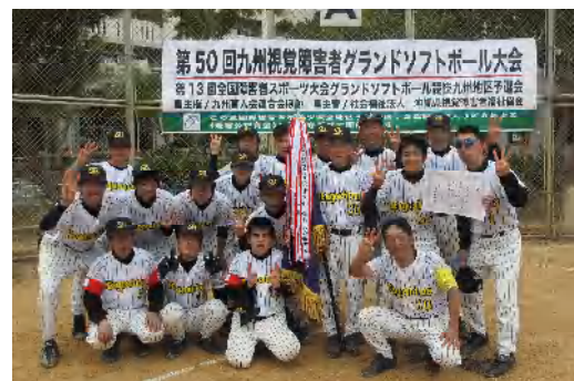
視覚障害者グランドソフトボール部