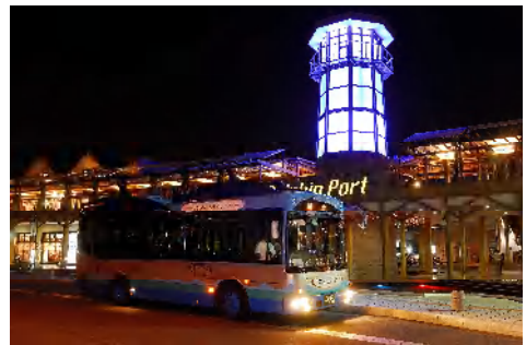
カゴシマシティビュー