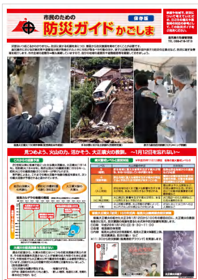
市民のための防災ガイドかごしま