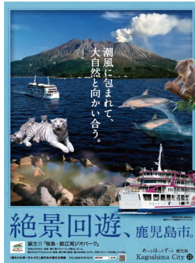
絶景回遊、鹿児島市。