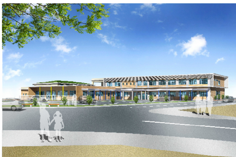
南部親子つどいの広場・新南部保健センター完成パース