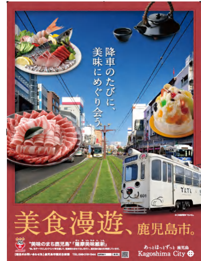
美食漫遊、鹿児島市。