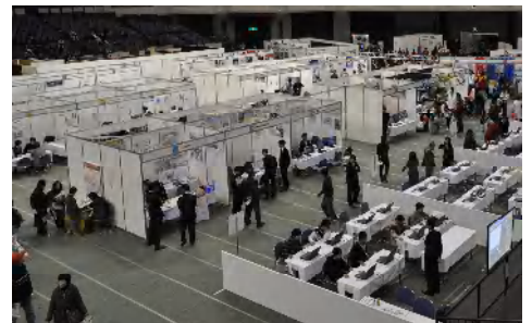
昨年のかごしまITフェスタ