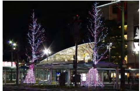
鹿児島中央駅前広場