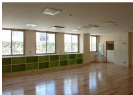
南部親子つどいの広場の内観 (左：子ども広場、右：託児室)