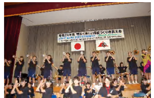
昨年の学校づくり実践発表