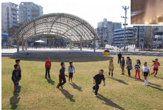
リニューアルした天文館公園