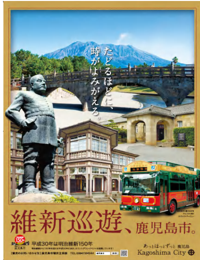
維新巡遊、鹿児島市。

このたび2年ぶりに鹿児島市観光ポスターを一新した。この観光ポスターは、鹿児島市の素晴らしい観光の魅力をイメージさせ、鹿児島市を訪れたいという動機づけになるよう製作したもので、今後、県内外で活用し、本市観光のPRを行う。